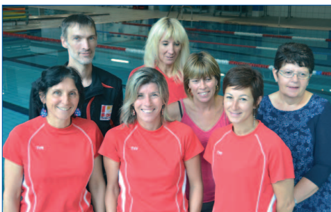
L'équipe de la piscine intercommunale.