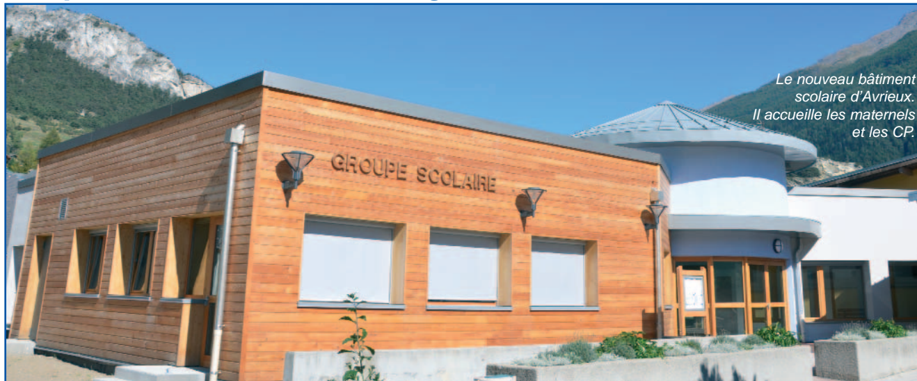
Le nouveau bâtiment scolaire d'Avrieux. Il accueille les maternels et les CP.