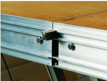
Profil de liaison