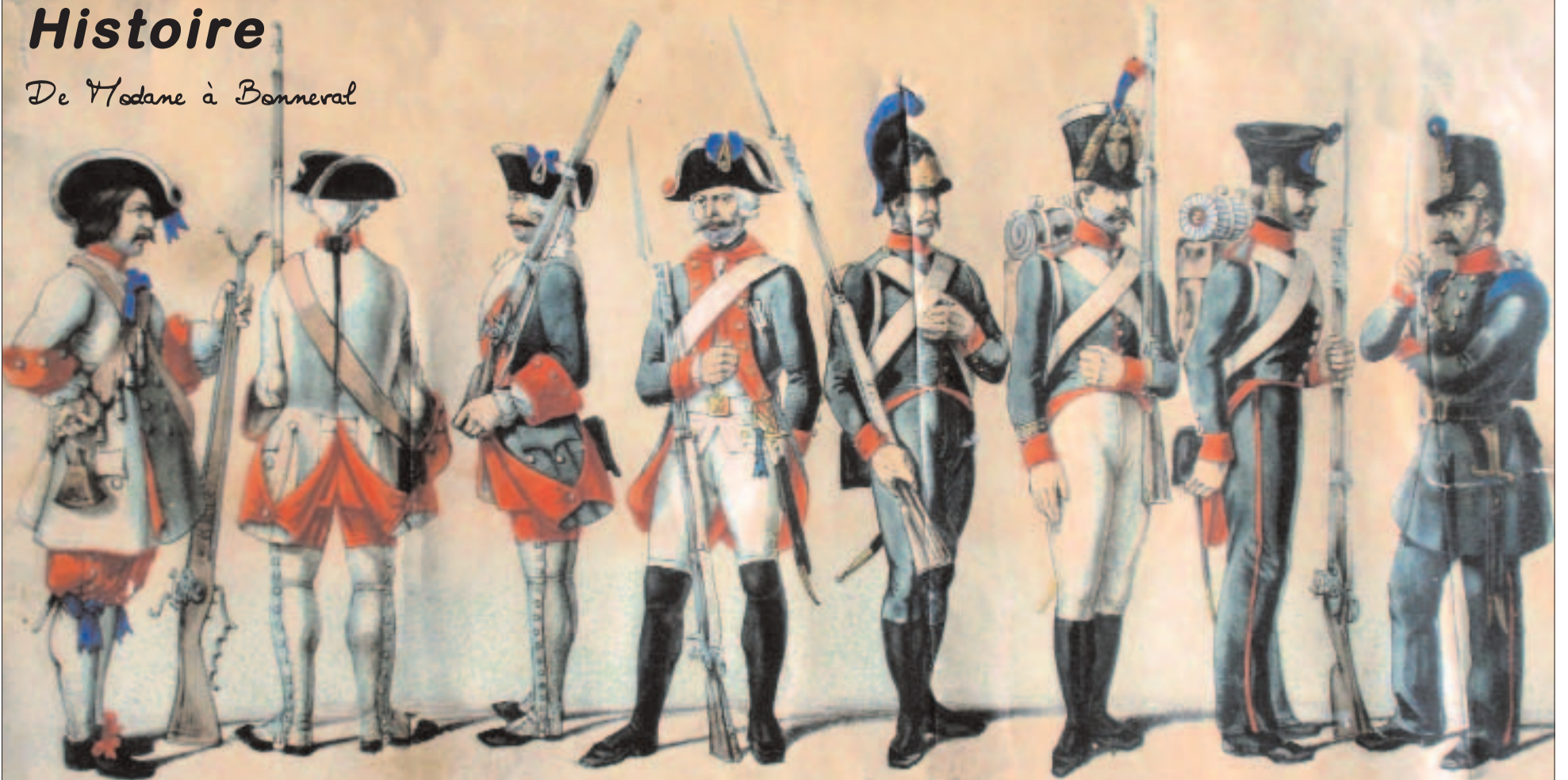
Evolution de l'uniforme et de l'équipement des soldats Piémontais entre 1664 et 1843. La Savoie n'est devenue française qu'en 1860.