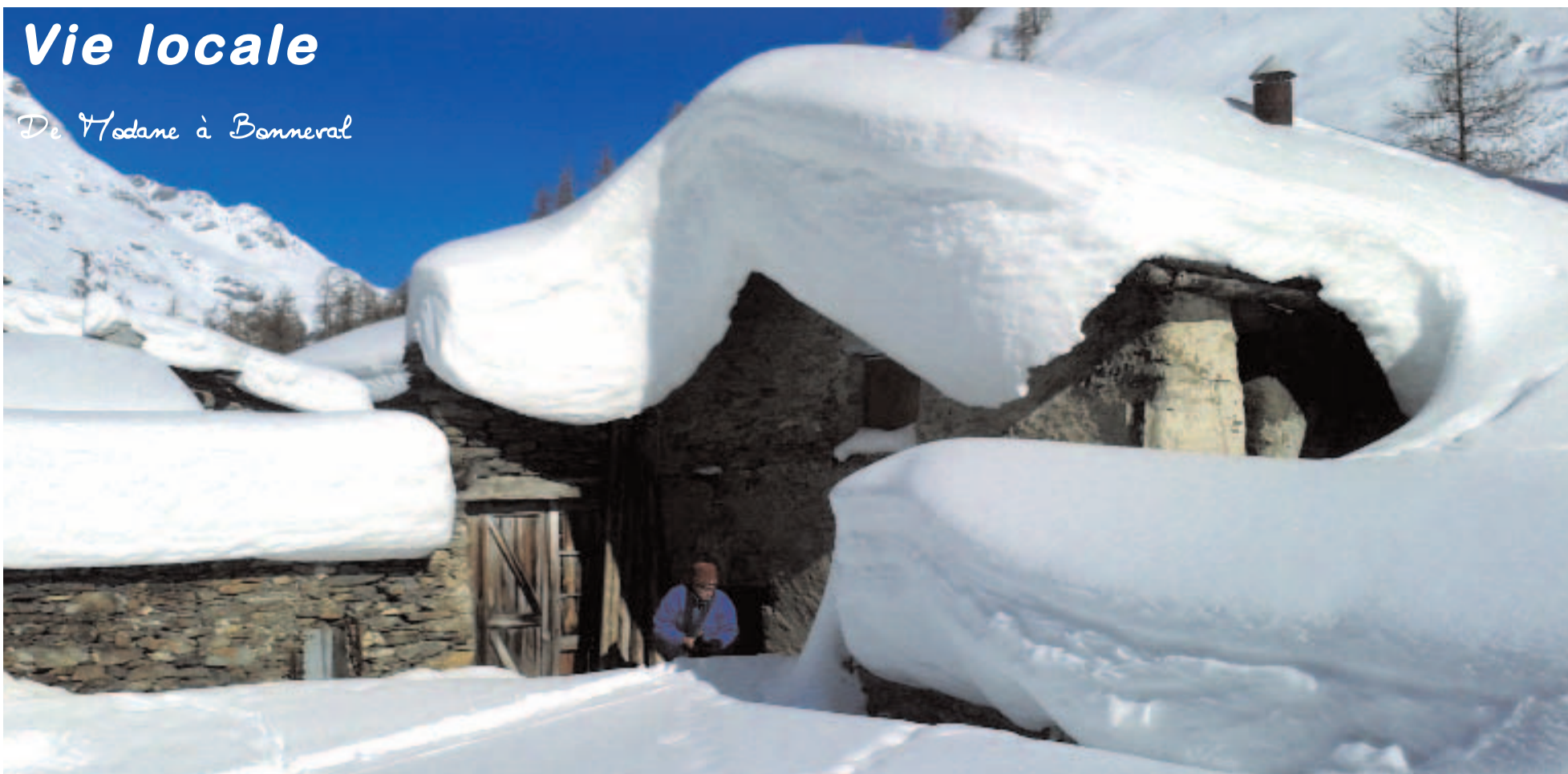
La Goulaz, un petit hameau à la sortie de Bessans. En hiver, seules deux maisons sont habitées.