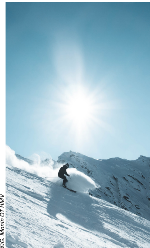
*Météo France + Institut national de recherche pour l'agriculture, l'alimentation et l'environnement + Dianeige, le bureau d'étude qui accompagne les projets d'aménagement touristique des territoires de montagne.

Dans la présente étude, toutes les stations de HMV ont fait l'objet d'une analyse exhaustive. Chacune va maintenant étudier en détail et en profondeur les prévisions qui la concernent pour pouvoir ensuite élaborer les orientations les plus adaptées au phénomène annoncé.