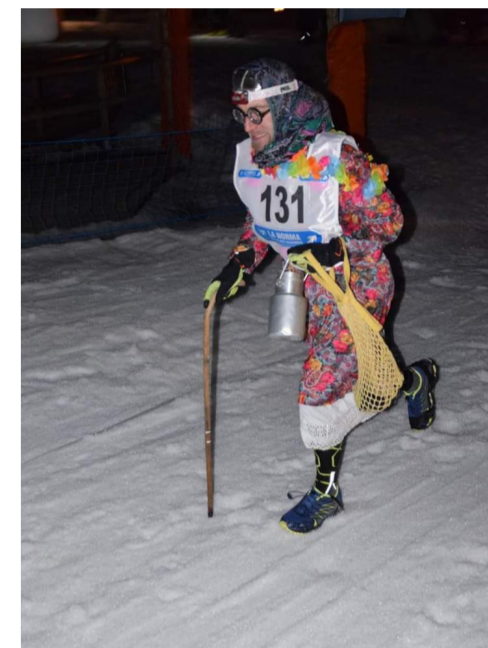
En vêtement traditionnel, mais nos experts n'ont pas pu déterminer de quel village provenait cette alerte participante :-)

Encore une belle manifestation organisée par l'association les JB et Les Amis de la Belle. Chaussés vos baskets, vos raquettes ou vos skis de randonnée et participez ! Départ à la Maison de La Norma, à 19h. Inscriptions 20 € sur place dès 18h. Certificat médical ou licence obligatoire. Remise des prix et repas à l'Eterlou. Des lots à gagner pour les plus beaux déguisements !