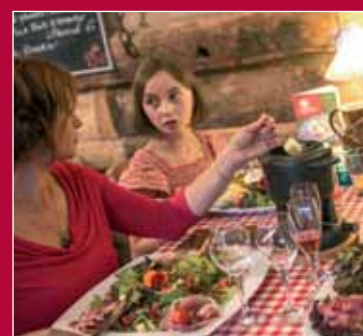
Fondue sur réservation. L'Estando, rue de Savoie à Termignon. Tél. : 04 79 56 59 93

Piquer viande, beaufort ou tomme de Savoie et les saisir dans un vin brûlant. Un concept original qu'on découvre au restaurant L'Estando à Termignon. Un établissement qui mélange plaisir des papilles et des oreilles avec de nombreuses soirées festives. On commence par chauffer le vin blanc (environ 1/2 bouteille) avec les aromates dans le poêlon. Le liquide doit frémir et rester bien chaud. Le boeuf et les fromages sont coupés en gros cubes. Reste à les piquer et à les tremper dans le vin. Selon les goûts, la viande peut être juste saisie ou bien cuite. Quant aux fromages, mieux vaut ne pas les oublier sous peine de ne plus rien avoir au bout de sa fourchette ! Peu à peu, les sucs de la viande passent dans le liquide. Un peu de fromage fond et le bouillon devient de plus en plus savoureux. Il arrive même que certains gourmands s'en offrent un bon bol en fin de repas. Une fondue digeste et originale servie avec une sauce tartare maison, un gratin dauphinois et des petits légumes. Des légumes qui finissent bien souvent dans le bouillon et qui ajoutent leurs saveurs à celle du vin, de la viande et des fromages. Une recette de "La Maurienne dans l'assiette" qui vise à favoriser le patrimoine culinaire local et les circuits courts.