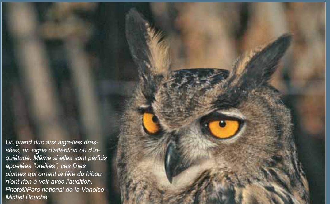
Un grand duc aux aigrettes dressées, un signe d'attention ou d'inquiétude. Même si elles sont parfois appelées "oreilles", ces fines plumes qui ornent la tête du hibou n'ont rien à voir avec l'audition.