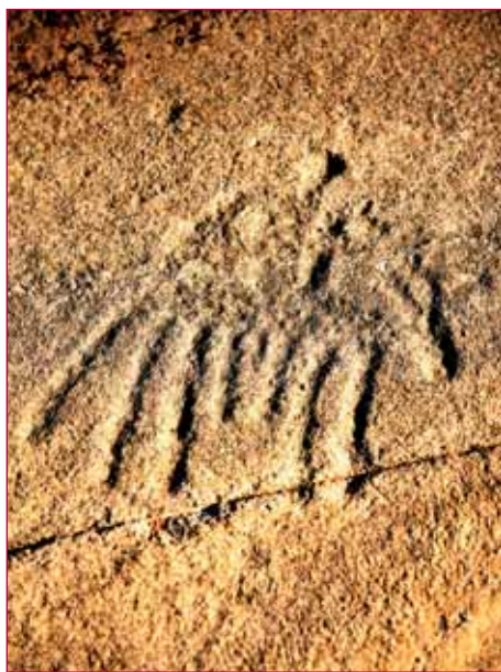
Gravure au site des Lozes.

L'archéologue modanais René Chemin propose une conférence sur "l'archéologie en Maurienne du néolithique (-4000 avant J-C) à l'an Mil. La Haute Maurienne recèle de nombreux sites archéologiques avec par exemple la grotte des Balmes, le Rocher du Château ou le parc des Lozes. A la fin de la conférence, l'archéologue propose d'ailleurs aux participants d'aller découvrir ce site des Lozes à la lueur des lanternes. De grandes dalles à la sortie d'Aussois où l'on découvre des dizaines de gravures représentant des duels, des scènes de chasse... Un site unique qui prend encore plus d'ampleur quand on le découvre de nuit.