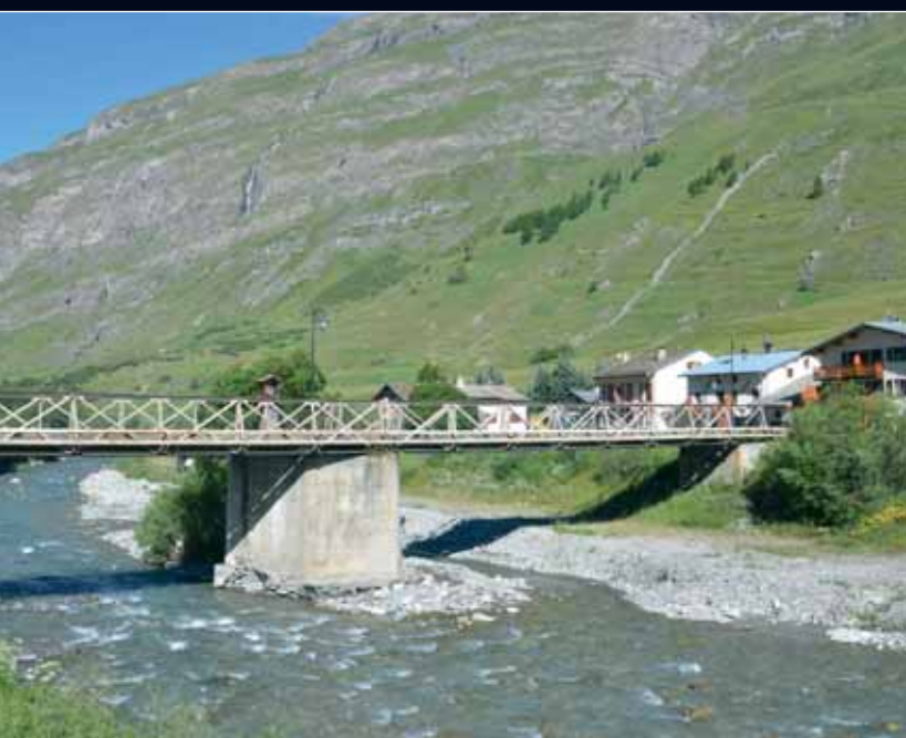
Le pont de Bessans. Un pont qui est plus emprunté par les randonneurs (et par les skieurs en hiver : les remontées mécaniques sont à droite) que par les véhicules.