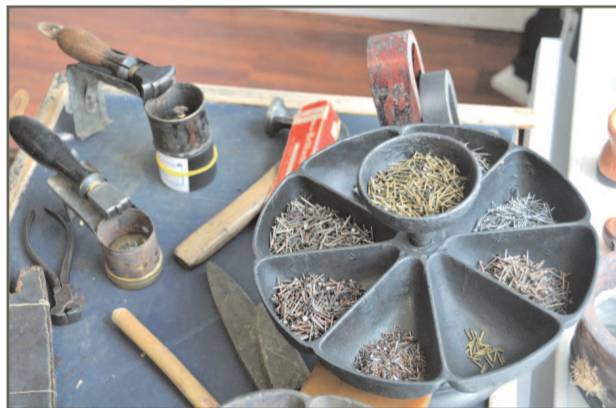
A droite, une marguerite servant à séparer les différentes semences (les clous). A gauche, deux mailloches prêtes à chauffer. Ces outils servaient à lisser les peaux et les cuirs.

Si le métier est plus rare aujourd'hui, les cordonniers étaient très nombreux jusqu'au milieu