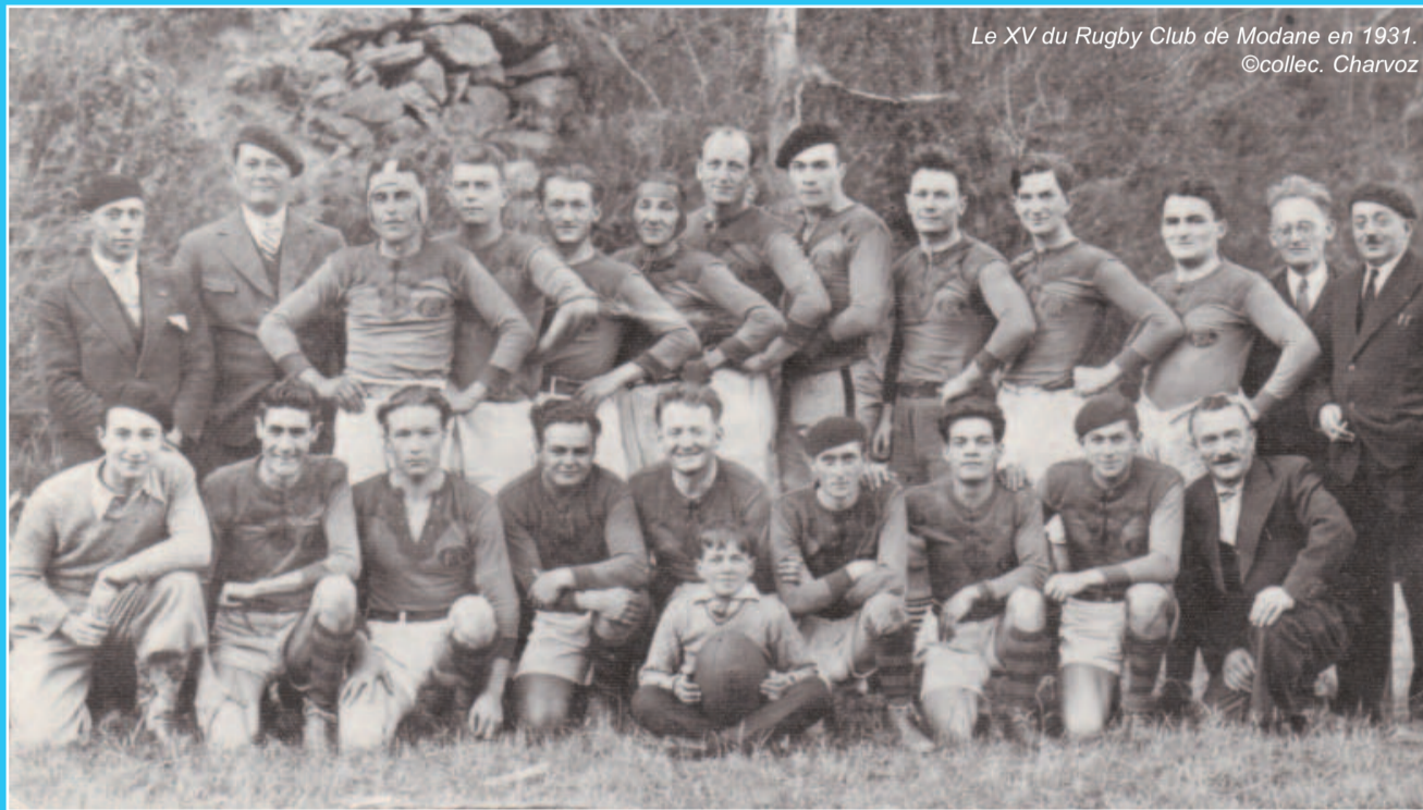
Le XV du Rugby Club de Modane en 1931.

Le sport est une véritable tradition en Haute Maurienne. Certains clubs toujours en activité affichent d'ailleurs un âge vénérable : l'association Sports Hiver Modane-Valfréjus a par exemple été créée en 1920, 1 an après le club de foot de l'US Modane. Mais d'autres clubs existaient avant ces presque centenaires.