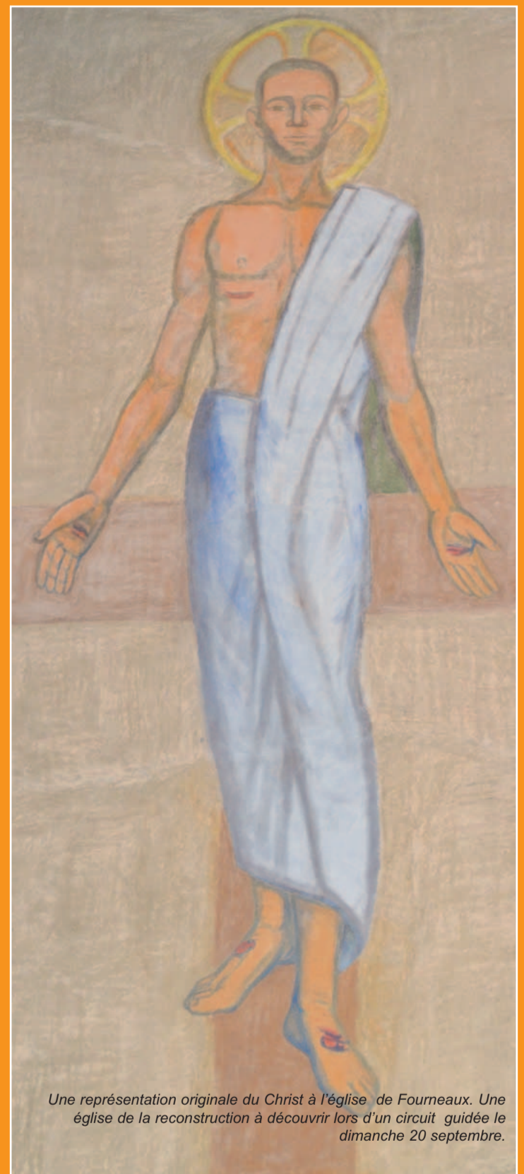
Une représentation originale du Christ à l'église de Fourneaux. Une église de la reconstruction à découvrir lors d'un circuit guidée le dimanche 20 septembre.

Retrouvez le programme complet en Savoie à la Maison cantonale ou sur journeedupatrimoine.fr