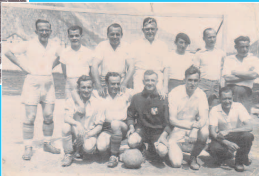
Ci-contre, l'équipe de foot de La Praz dans les années 20.