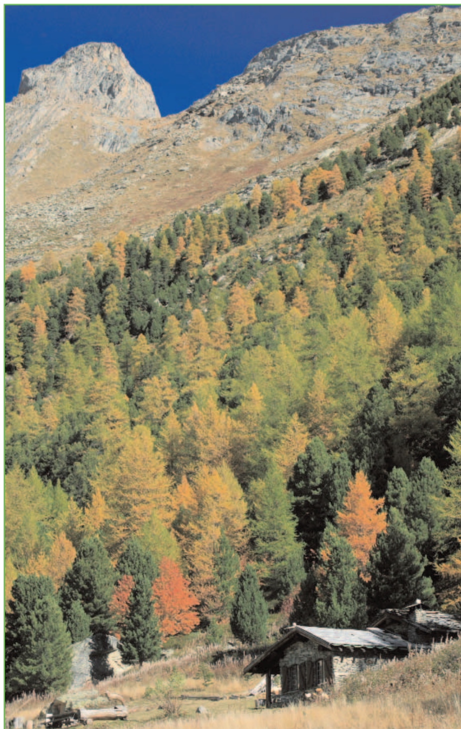
L'Orgère abrite des arbres aux formes étonnantes. Au cœur de cette forêt non exploitée on peut ainsi voir des arbres qui ont poussé sur des rochers, d'autres sur des troncs... De très vieux arbres sont également tapis au sein des conifères : certains ont déployé leurs premières branches à l'époque de Jeanne d'Arc... Une forêt à découvrir grâce au sentier nature tracé entre mélèzes et cembro.

A noter également que la Maurienne compte le plus gros mélèze d'Europe à Montricher-Albanne. Un arbre de 600 ans qui affiche 6,40m de circonférence.