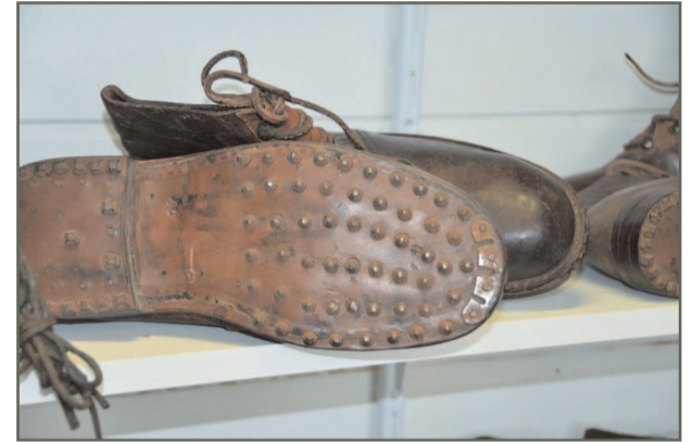
Ci-dessus, semelles cloutées. Les clous, "antidérapants", limitaient l'usure de la semelle.

Des ustensiles aux noms étranges qu'on découvre sur les murs de cette boutique. D'antiques machines à coudre et le rudimentaire établi paternel viennent compléter cette collection agrémentée de photos d'époque où l'on peut voir les aïeux Bolatto au travail à Fourneaux. Une collection que Robert Bolatto présente avec passion en distillant anecdotes et contexte historique. Face aux outils et aux rangées de chaussures de cuir impeccablement préservées depuis des décennies, le visiteur a forcément un coup d'œil pour ses propres souliers.