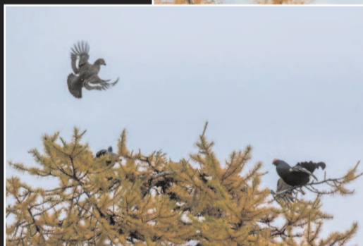
Ci-contre, une poule vient rejoindre deux coqs sur un mélèze au-dessus de La Norma.