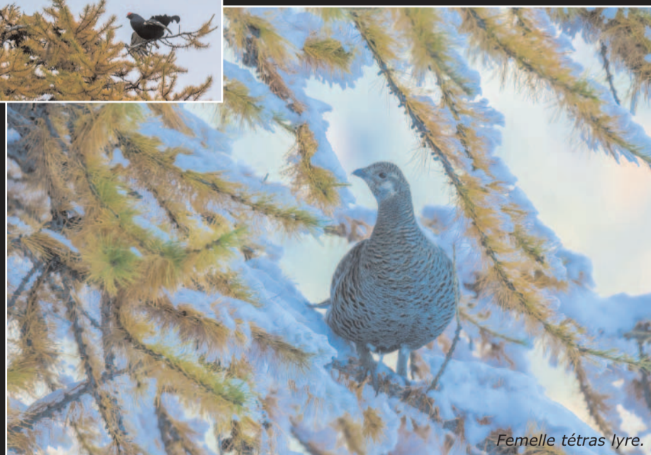
Femelle tétras lyre.

s'envoler dépense beaucoup d'énergie alors qu'il peine à se nourrir quand la neige est là. Certaines stations lancent donc des campagnes de sensibilisation auprès des skieurs en signalant les zones où les galliformes (lagopèdes et tétras) hivernent. La Norma a par exemple mis des panneaux et des filets autour de petits secteurs pour préserver les lagopèdes. Si certains amoureux de la nature militent pour des zones plus vastes et strictement interdites, la cohabitation entre faune sauvage et activités de loisirs essentielles à l'économie locale reste difficile à trouver. Difficile mais pas impossible. Des stations comme Flaine ou Courchevel ont mis en place des plans d'actions pour protéger l'oiseau. Une démarche qui fait partie des mesures compensatoires pour développer les stations, mais qui a un aussi un vrai intérêt pour la faune. Et plus qu'un caillou dans les chaussures de ski des stations, ces zones peuvent aussi être un nouvel argument commercial à l'heure de la préoccupation environnementale.