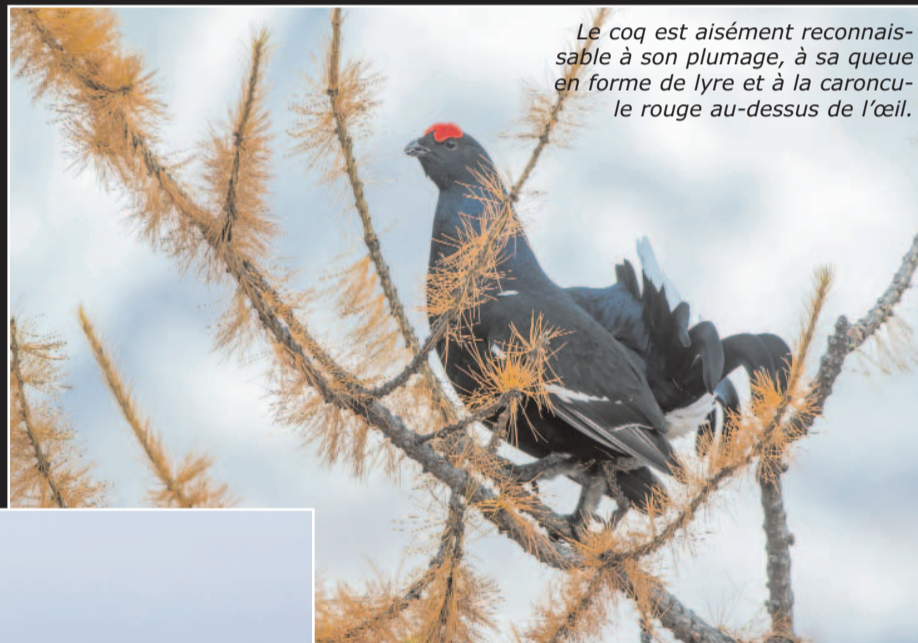
Le coq est aisément reconnaissable à son plumage, à sa queue en forme de lyre et à la caroncule rouge au-dessus de l'œil.

Chassé l'automne, le tétras est aussi dérangé l'hiver par les amateurs de poudreuse. Un oiseau qui doit