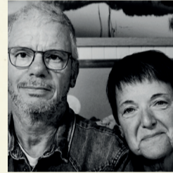
CHRISTIAN ET MYRIAM SIMON PHOTOGRAPHES DE NATURE