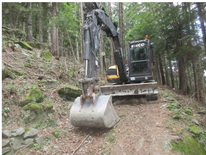
Travaux d'aménagement des accès en crête de falaise (crédit photo Département Savoie)