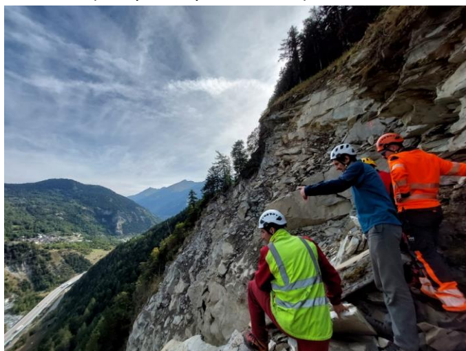
Visite des géotechniciens SAGE/CD73/RTM et SNCF